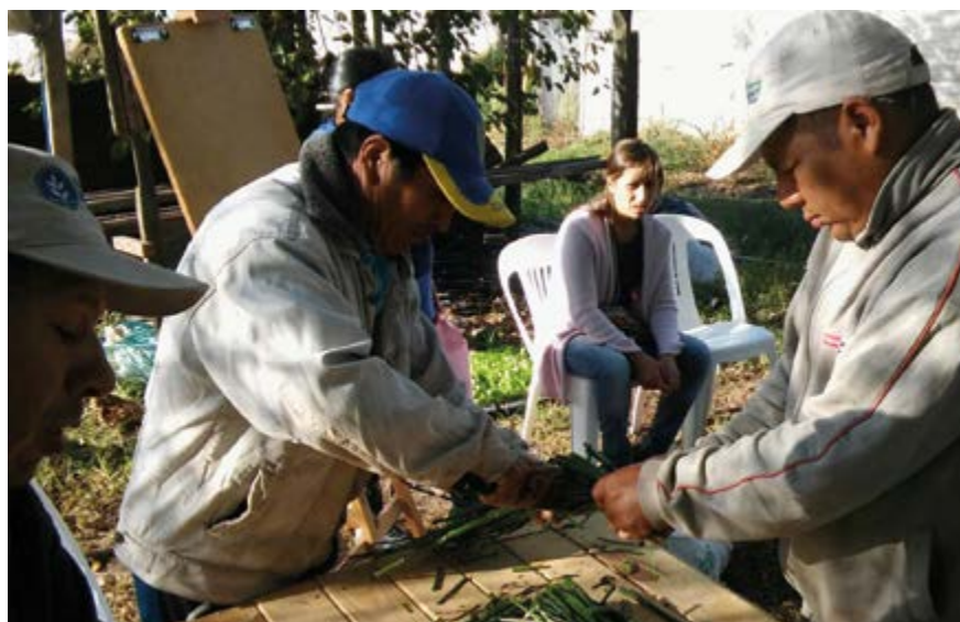
| La UNAJ se vincula con productores hortícolas rurales de Florencio Varela.