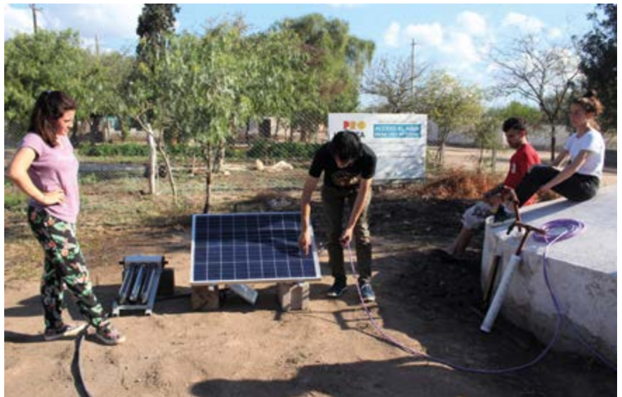
| Desde la UNVM se apunta al estudio de energías renovables.

En esta línea, en la que muchos estudios y opiniones abonan la idea de educar al calor de las luchas socio-ambientales, las casas de estudios de Villa María, La Rioja, Autónoma de Entre Ríos, Lanús, Río Negro y Arturo Jauretche son ejemplo de la incorporación en sus propuestas académicas de carreras de gestión ambiental (o con denominaciones similares) y apuntalan al involucramiento de estudiantes y docentes con otros actores del territorio, bajo la premisa general de articular la enseñanza/aprendizaje de conocimientos específicos con otras tareas de concientización y sensibilización que, en definitiva, ponen a la participación ciudadana en el centro de la escena.