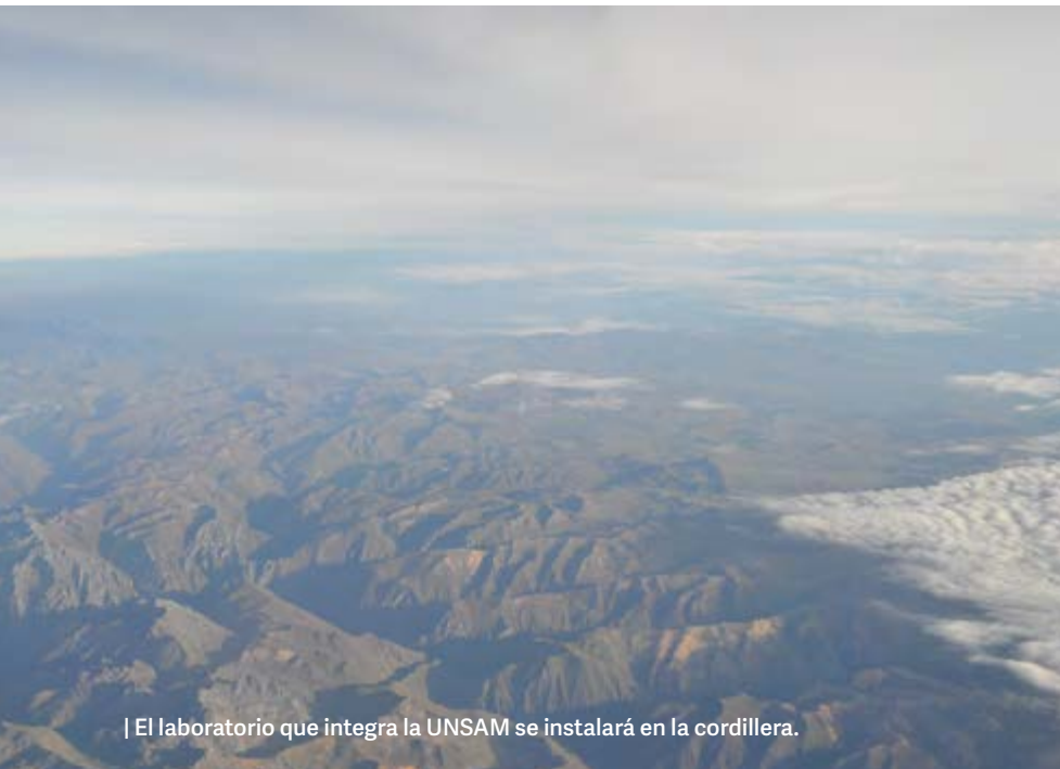
| El laboratorio que integra la UNSAM se instalará en la cordillera.

Liderado por el Consorcio Latinoamericano de Experimentos Subterráneos (CLES), el ambicioso proyecto será instalado a la vera del túnel Agua Negra, una ruta subterránea de 14 kilómetros de longitud que unirá la provincia de San Juan con la cuarta región de Chile en la zona Agua Negra y que representa una tramo clave del gran corredor bioceánico -el que conectará los océanos Pacífico y Atlántico desde el puerto de Coquimbo (Chile) hasta Porto Alegre (Brasil)-. Para el inicio de la primera etapa, el BID anunció un financiamiento de 1.500.000.000 de dólares.