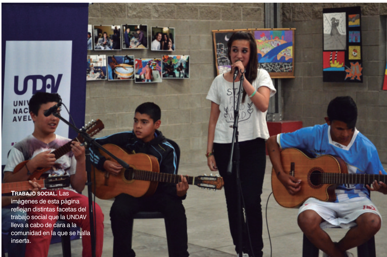
TRABAJO SOCIAL. Las imágenes de esta página reflejan distintas facetas del trabajo social que la UNDAV lleva a cabo de cara a la comunidad en la que se halla inserta.

Secretaría de Políticas Universitarias (SPU). El proyecto se denomina “Articulación entre niveles educativos. Garantizando la inclusión universitaria de sectores socialmente vulnerables a través de la interacción entre la Costa del Paraná y la Costa del Uruguay”.