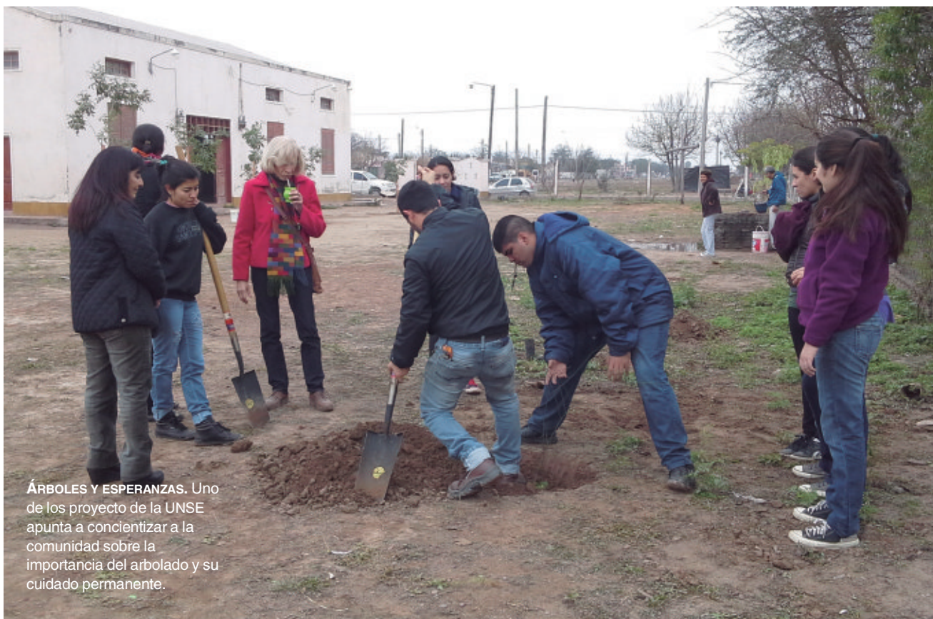
ÁRBOLES Y ESPERANZAS. Uno de los proyectos de la UNSE apunta a concientizar a la comunidad sobre la importancia del arbolado y su cuidado permanente.