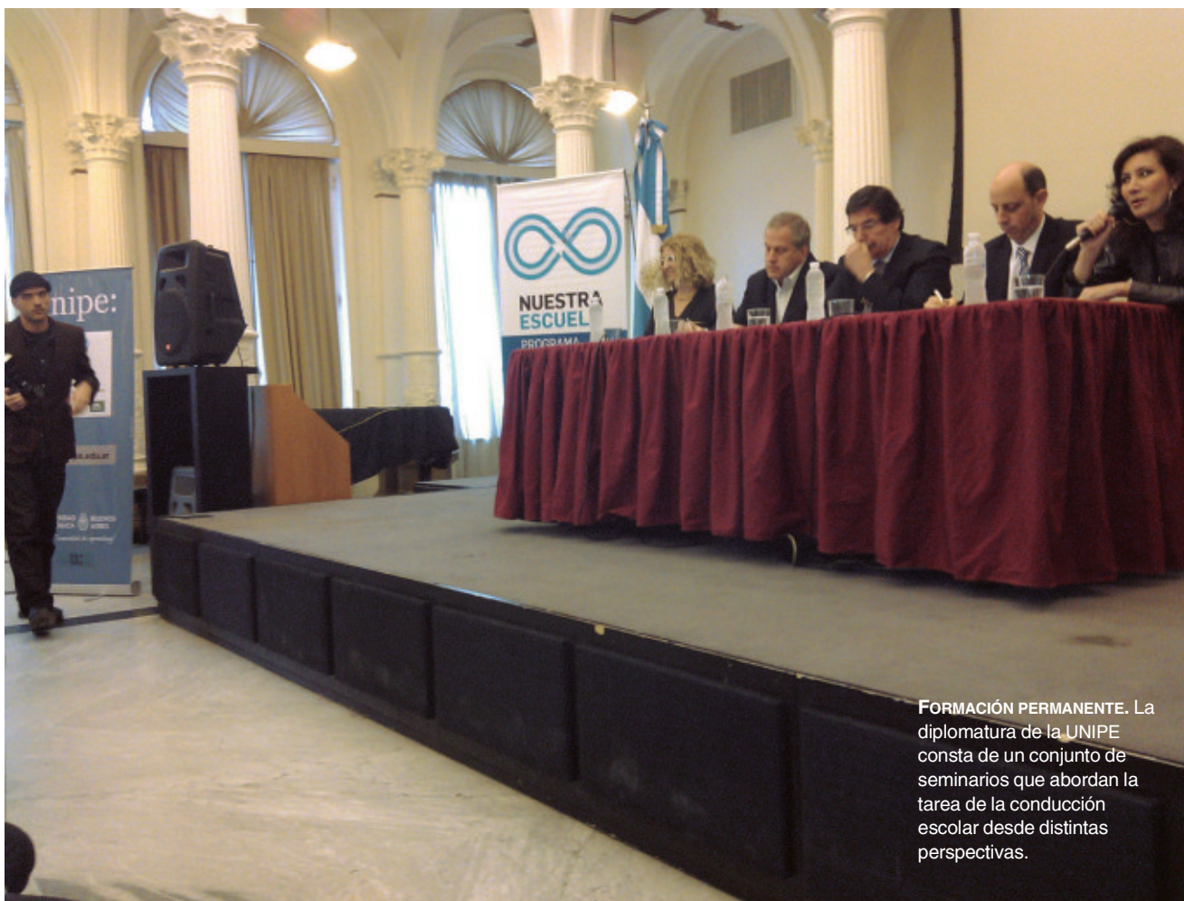
FORMACIÓN PERMANENTE. La diplomatura de la UNIPE consta de un conjunto de seminarios que abordan la tarea de la conducción escolar desde distintas perspectivas.